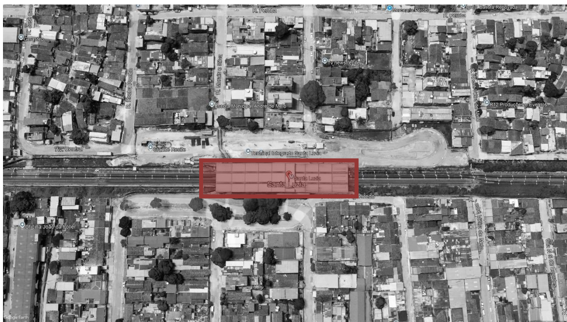
FIGURA 1 – ESTAÇÃO SANTA LUZIA